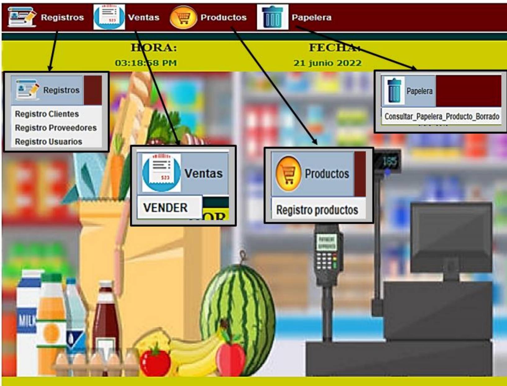
Figura U 2 Menú principal

En la figura u2 se puede visualizar la ventana que representa el panel principal con sus respectivas opciones.